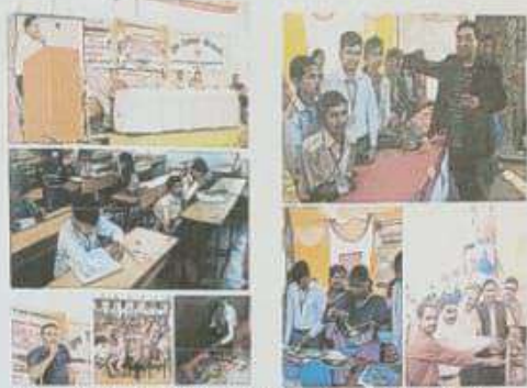
International Day for Disabled 01.12.17