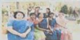
Educational Tour to NTPC